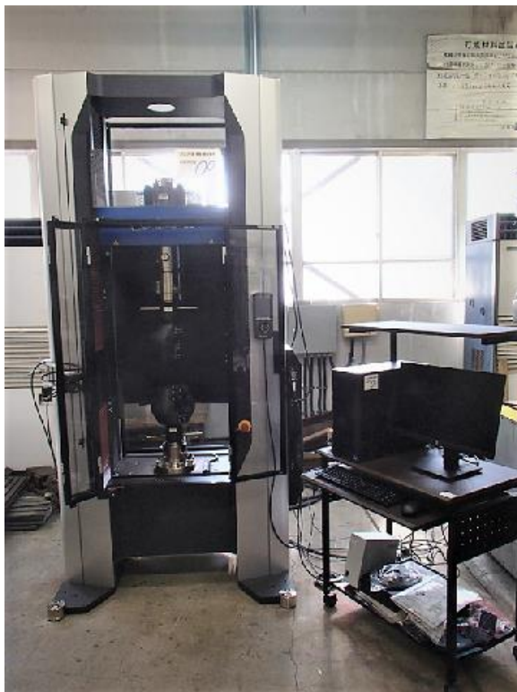
図1 精密万能試験機

この試験機は、金属材料等の強度試験（引張・圧縮・曲げ試験）を行うもので、負荷方式がACサーボモーター駆動で、最大荷重300キロニュートンまで対応している。また、非接触式ビデオ伸び計を装備しており、リアルタイムで標点間の伸びを計測できる。